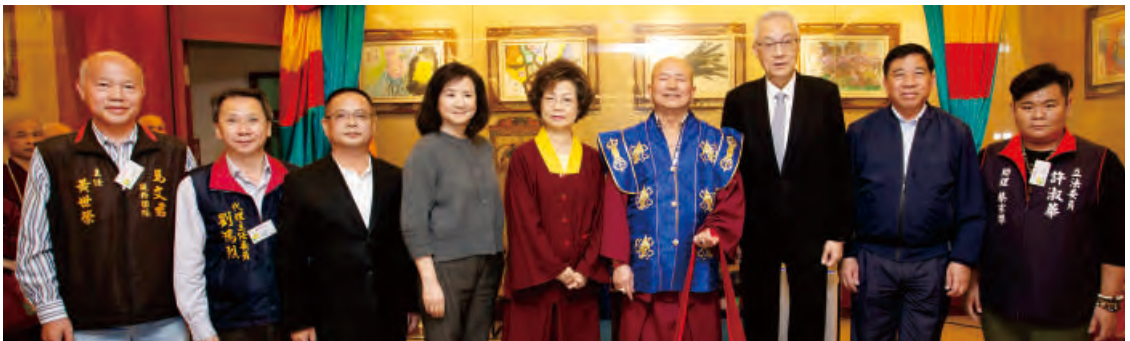
國民黨主席吳敦義先生偕同伉儷吳夫人，與南投縣各級官員，前來拜訪師尊及參與法會。