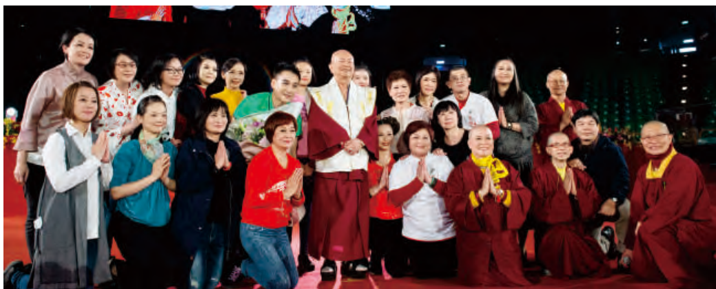
謝師宴結束後，法王與主辦單位的工作人員合影

做爲比喻，仔細地闡釋中觀思想，並告訴大家，人的思維，時而專一，時而飄走，「不偏於有，也不偏於空」，即表示，中觀就是不偏於世俗諦，也不偏於究竟（勝義諦），也就是「圓融」。法王也告訴大家，我們所修的佛法，是方便智慧和成佛菩薩二者合起來的，這才是佛法，也就是中觀。法王也談到普賢十願，也詳細解釋華嚴三觀：空觀、假觀、中觀。最後法王也期望兩岸以中觀的思想和平相處，「飲水思源」，坐下來好好談一談，爲老百姓將制度、政權談好，彼此要圓融，不要有戰爭，各退一步，海闊天空。（師尊詳細開示內容請看近期燃燈雜誌） 蓮生法王開示後，慈悲賜授與會大眾「龍樹菩薩本尊法」及「華嚴經智慧、中觀論、千轉輪法灌頂」，現場四眾弟子虔誠通過灌頂幡，領受師佛及本尊龍樹菩薩慈悲法流灌頂，希望業障消除，心靈清淨光明，福慧具足。大眾在如此殊勝法流中，心滿意足滿載而歸，圓滿結束「龍樹菩薩大法會」。