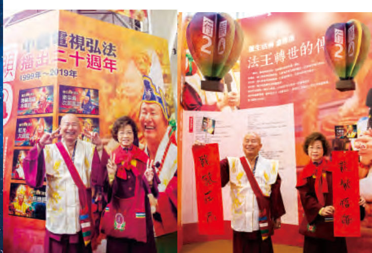
←師尊、師母在熱氣球天燈區合影