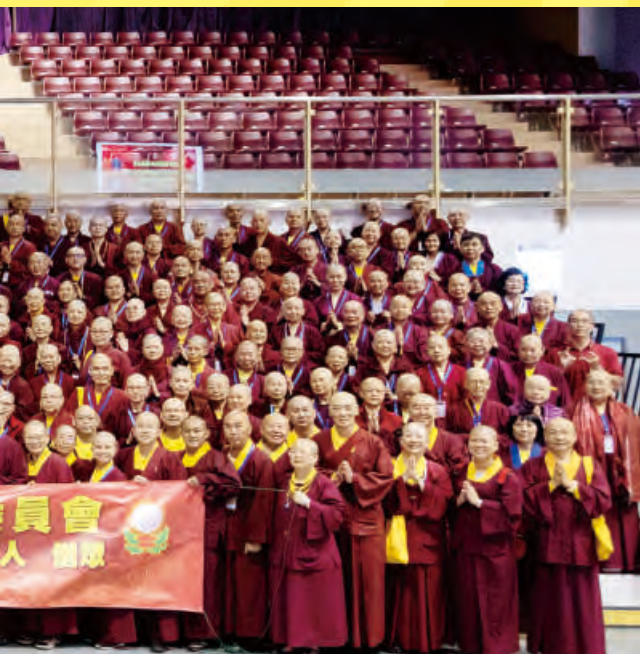
←師尊和參與研習會的眾人大合照