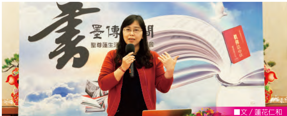
■文 / 蓮花仁和