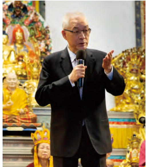
現任國民黨黨主席吳敦義先生致詞表達：聖尊主持如此殊勝法會，一定會得到上天的護佑。並祝福大家身體健康，家家幸福，事業成功，工作順利，也希望這場法會能庇佑台灣風調雨順，國泰民安，海峽兩岸和平穩定發展。