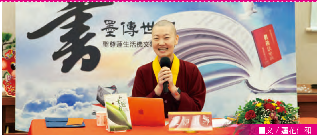
■文 / 蓮花仁和

一一〇一九年二月十六日「真佛般若藏」蓮生活佛文集讀書會，再度邀請巴西〈真諦雷藏寺〉