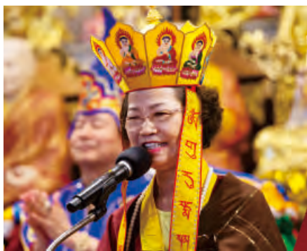
師母蓮香上師致詞

領受傳法大法會，接受灌頂，最可貴的是一位成就者的攝召，能夠請動所有諸佛菩薩下降來注照大家，這是每一場法會的重點，誰有能力能夠攝召佛菩薩，真的全部下降，金剛護法、