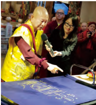
師尊揮毫大福金剛賜財符，並解說此符含意