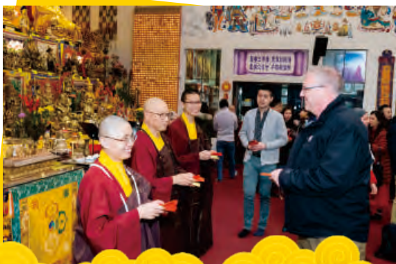
師尊加持的紅包，由仁波切與眾上師發給大家。

是冰天雪地，處處路滑。善信們攜家帶眷，大包小包的，謹慎的開車前往〈西雅圖雷藏寺〉參加大年初一「佛前大供」。大雄寶殿瀾漫著裊裊的香煙，小孩在人堆中穿梭，法師們幫忙香客解簽，忙進忙出，熱鬧非凡。 〈西雅圖雷藏寺〉在新的一年，虔誠祈求最尊貴的師尊佛體安康、長壽自在、常住世間、大轉法輪，也祝福親愛的師母身體健康、快樂自在，並祝福大家新的一年家庭圓滿、富貴臨門、修行有成、豬年紅紅火火、「豬」事順利吉祥。