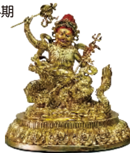
騎龍白財神 高 12cm 寬12cm 深9cm