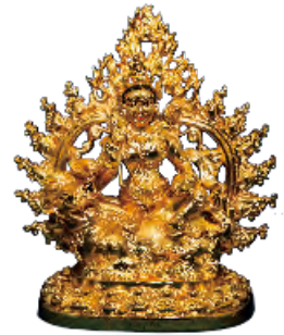
財寶天王 高 12cm 寬 11cm