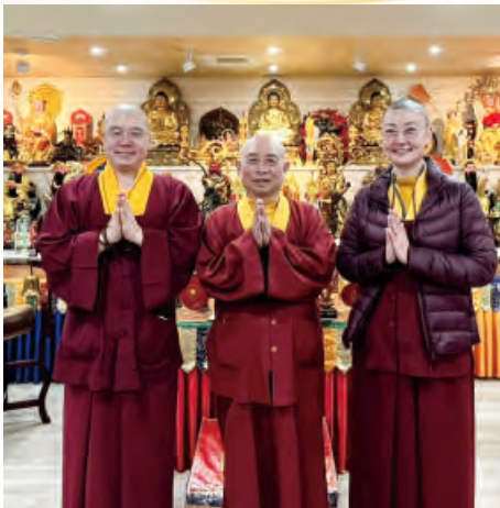
▼ 拜訪法舟堂釋蓮郢上師