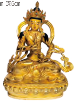
金剛薩埵金身 高14.8cm 寬10.6cm 深6.6cm