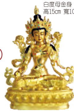
白度母金身 高15cm 寬10cm 深6cm