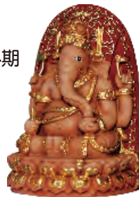
紅財神金身 高13.5cm 寬8cm