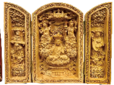
蓮花童子佛龕 高10.5cm 展開寬14cm