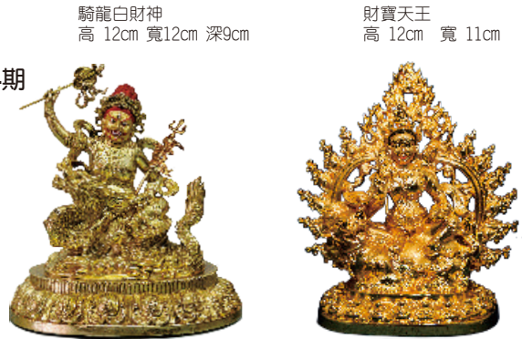
騎龍白財神 高 12cm 寬12cm 深9cm