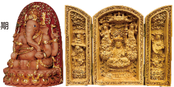
紅財神金身 高13.5cm 寬8cm