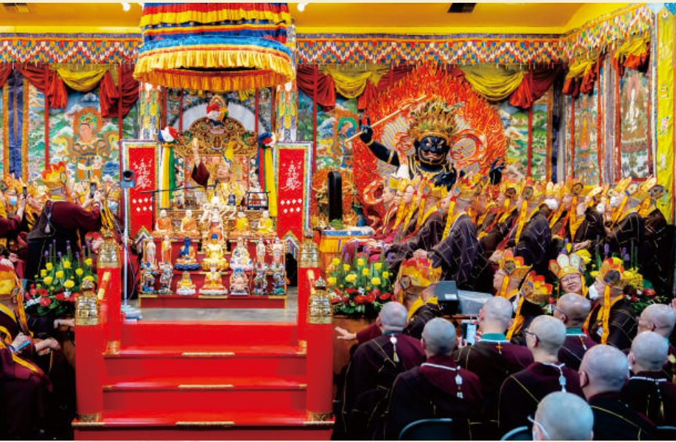
2023年9月9日 西雅圖雷藏寺 癸卯年秋季大法會及首傳「聖觀音第一富豪法」

文字 / 燃燈雜誌 整理 法會 / 癸卯年秋季大法會 地點 / 彩虹雷藏寺