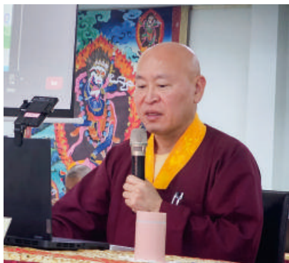
長老釋蓮僧上師講授「百丈清規」