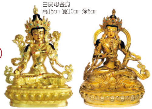
白度母金身 高15cm 寬10cm 深6cm